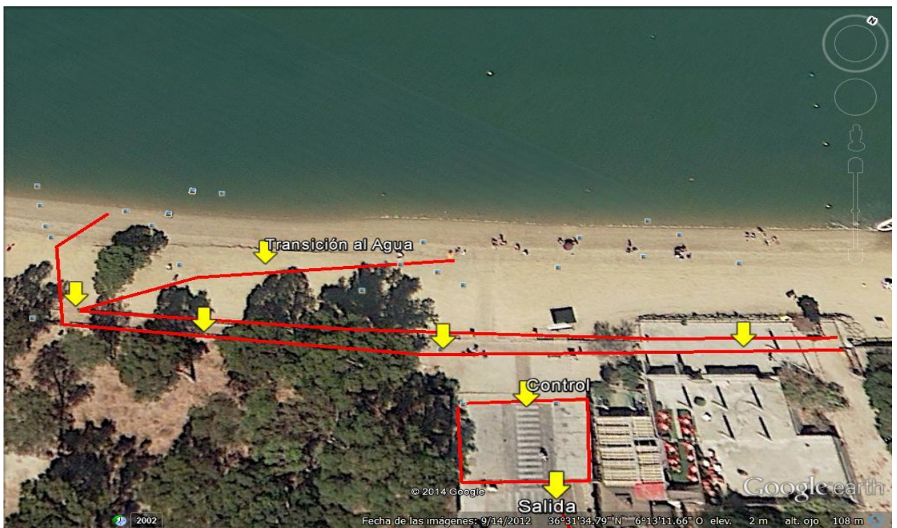
Transición al Agua